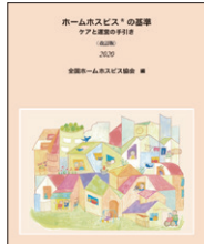
「ホームホスピス®の基準(改訂版)表紙。ホームホスピスの理念、ケア、環境、運営のあり方を定めた基準を網羅

2004年に宮崎市で誕生した「かあさんの家」から始まったホームホスピスの理念は、その後全国に広がり、各地に「ホームホスピス」が生まれました。そこで2015年8月、全国ホームホスピス協会を設立し、ホームホスピスの理念やケア、環境や組織についての基準を定め、「ホームホスピス」を商標とし、基準に沿った運営をしている事業所を「ホームホスピス」と認証してきました。また、協会独自の教育プログラム「ホームホスピスの学校」によって新たに開設する人を育成し、開設後も継続的な研修プログラムを提供して、そのケアや環境の質を維持することに努めています。