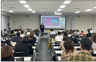
◀札幌で開催した「第11回ホームホスピス全国大会」の様子(2022年10月)